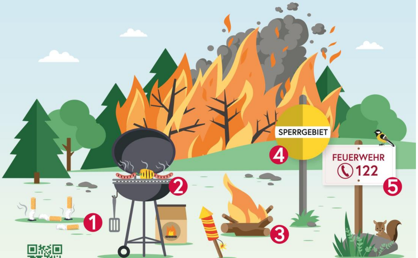
ILLUSTRATION: © BML/ZENZ